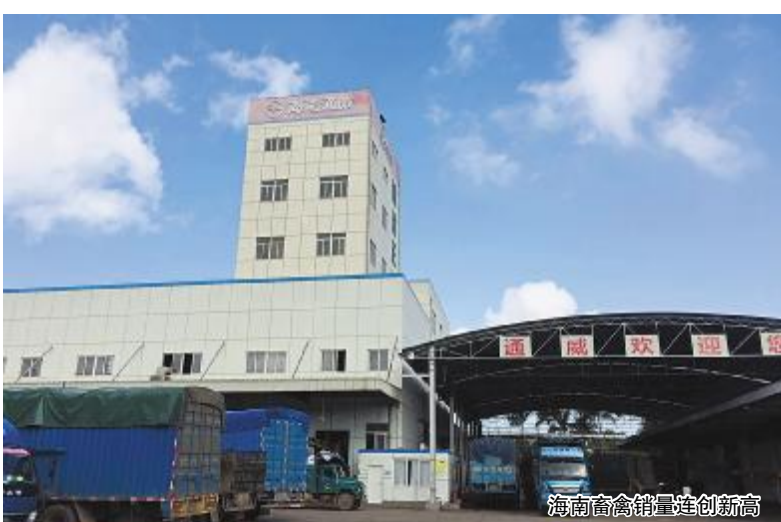
海南畜禽销量连创新高

今年以来,海南畜禽坚持内外全面精益化管理,坚持“质量第一、效率优先、全员营销”的工作原则,坚持“以客户为中心、以质量生命、以团队为依托”的工作思路。10月份以来,公司克服市场残酷竞争,强台风“沙莉嘉”破坏来袭、原材料采购和运输紧张等诸多不利因素,始终坚持变革创新、开源节流,紧紧依托团队力量,攻坚克难,主动出击,快速突破,稳健增长;进入11月,全体营销、服务将士们继续发扬“召之即来、来之能战、战之能胜”的连续作战、屡战屡胜的顽强拼搏精神,实现了今年连续5个月的历史新高,特别是在进入淡季的11月份,实现了淡季不淡、产销两旺的喜人局面,首次突破20000吨大关,填补了股份公司单月畜禽总销量突破20000吨的空白。