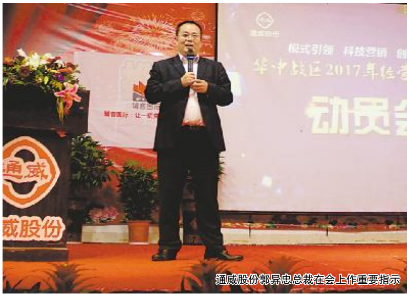
通威股份华中战区2017年度经营规划暨营销工作动员会现场照片

为总结本年度工作,及时规划下一阶段工作重点,沈总围绕“2017 年度经营规划暨 2016-2017 年度冬季重点经营工作”作主题报告,对战区愿景、经营方针、经营发展方向、经营发展思想、经营管理规划等方面进行了详细部署。