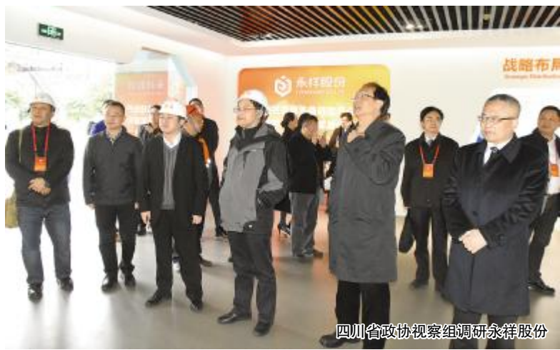
四川省政协视察组调研永祥股份

本报讯(通讯员 龙小龙)11月23日,四川省政协常委、经济委员会主任王海林,省政协副主席杨富,省政协经济委员会主任雷建,省政协经济委员会副主任王元勇等领导莅临永祥股份调研,通威集团副总裁胡荣柱,通威股份董事、永祥股份董事长兼总经理段雍及永祥股份高管团队热情接待并座谈。 王海林主任一行先后参观了永祥股份体验中心、永祥多晶硅还原车间、永祥树脂离子膜烧碱车间,详细了解了永祥股份的发展历程以及永祥在多晶硅和氯碱方面的技术创新成果。