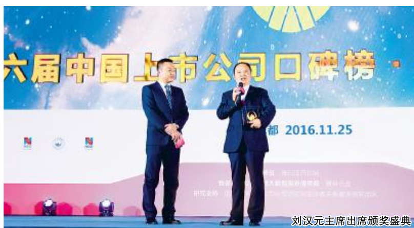
刘汉元主席出席颁奖盛典

刘主席在演讲中指出,面对当前日益严重的环境和雾霾问题,必须加快推进清洁能源,尤其是光伏发电的建设速度,才能标本兼治。刘主席表示,2015年全国燃烧43亿吨吨煤,煤炭超过10亿吨,石油