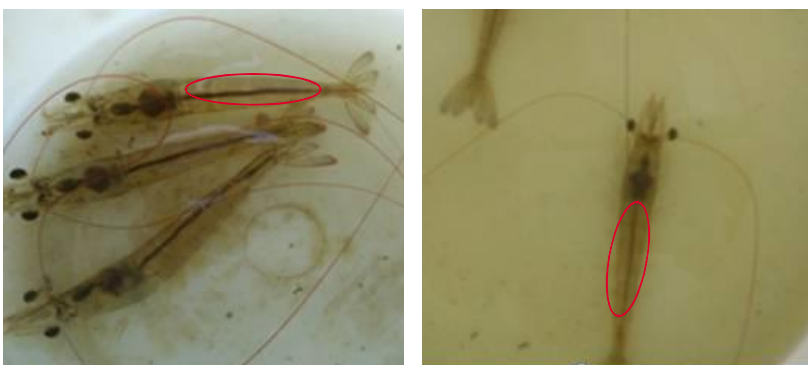
图 2 使用“虾肝强”养殖 45 天的对虾(左)和未应用“虾肝强”养殖 45 天的对虾(右)

针对江苏地区的调研主要围绕如东、海安两地开展。使用“虾肝强”产品及技术的盈利塘口占比为 63.1%。比未使用“虾肝强”产品及技术的盈利塘口占比(35.9%)高 27.2 个百分点(表 6)。 众所周知,能否处理好对虾的应激和疾病,直接影响到对虾的养成。不难看出,无论是广东、海南还是江苏,在众多调研的养殖户中,使用“虾肝强”产品及技术的养殖户,养成盈利情况都要优于未使用该技术的塘口。这也可以从侧面反映“虾肝强”提高抗应激、抗病力的表现。