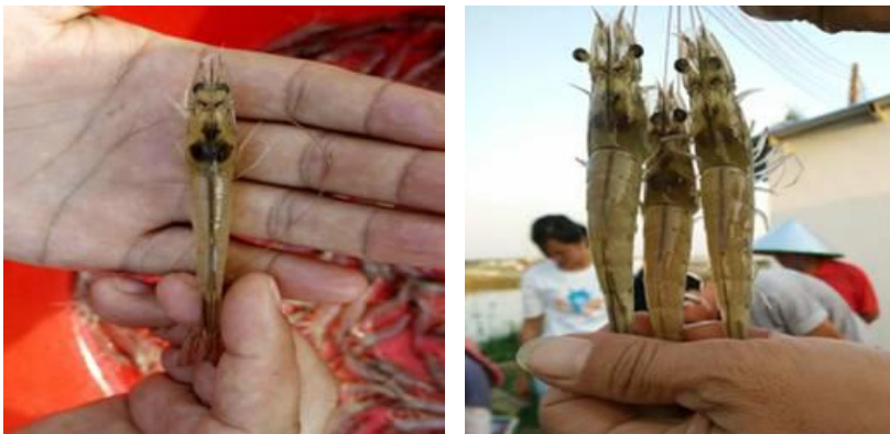
图 1 使用虾肝强技术养殖的南美白对虾

结果表明:冬茬虾养殖,使用“虾肝强”产品及技术的盈利塘口占比为 68.8%,比未使用“虾肝强”产品及技术的盈利塘口占比(48.1%)高出 20.7 个百分点(表 2)。早茬虾,使用“虾肝强”产品及技术的盈利塘口占比为 77.4%,比未使用“虾肝强”产品及技术的盈利塘口占比(60.0%)高出 17.4 个百分点(表 3)。 在本次调研中,海南的主要调研区域是昌化、乐东、东方、文昌、琼海、万宁、海口、三亚 8 个地区,其中: 冬茬虾的调研结果(见表 4):使用“虾肝强”产品及技术的盈利塘口占比为 76.6%,比未使用“虾肝强”产品及技术的盈利塘口占比(42.9%)高 33.7 个百分点。 而早茬虾的调研结果中(见表 5):使用“虾肝强”产品及技术的盈利塘口占比为 74.1%,比未使用“虾肝强”产品及技术的盈利塘口占比(61.5%)高 12.6 个百分点。