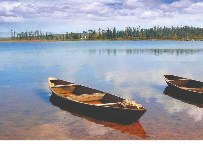
明月几时有，把酒问青天... 但愿人长久，千里共婵娟。

远方的友人赠给我一个月桂花做的香包... 桂花飘香，月圆人圆，这是最美好的时节。