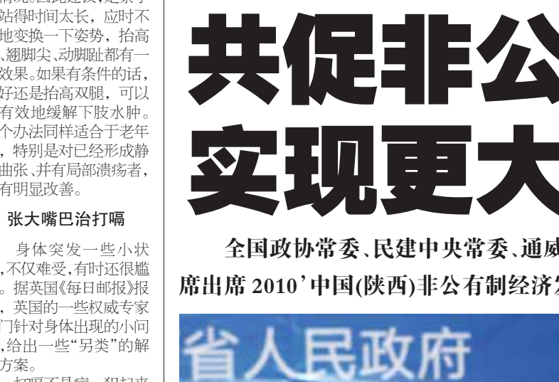
刘汉元副省长在开幕式上致辞