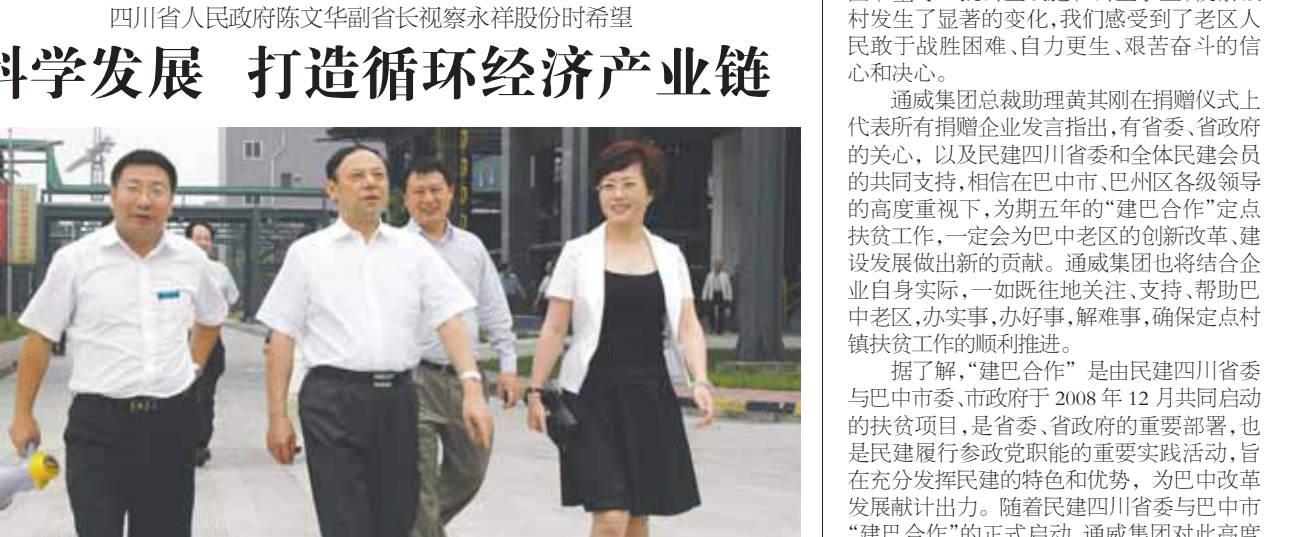
陈文辉副省长在视察永祥股份时