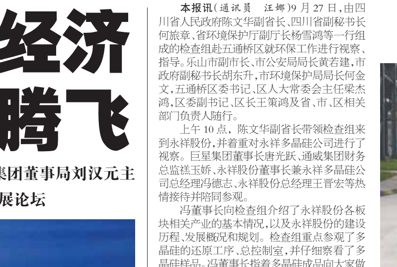
陈文辉副省长在视察永祥股份时