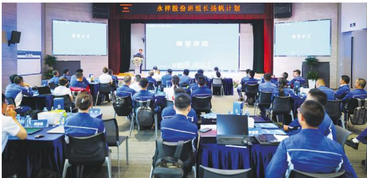
永祥股份“班组长扬帆计划”开班仪式现场

的工作都会产生较大偏差。希望在今后的内容开发中,各位内训师能够将操作标准和过程讲清楚,提升班组长的综合水平,做到执行准确、高效,以促进班组伙伴共同进步成长。 课程开发是一个动态的过程,其内容大多需要在开发、设计过程中不断更新。内训师们要学会角色互换,多思考班长需要为工段工作提供哪些支撑,多倾听新任班长、刚经历开班班长心声和切身感受,深入了解工作开展过程中的痛点、难点,贴合工作实际,寻找消除偏差的途径和方法。 刘总强调,扬帆计划开发出的课程可以帮助班组长规范操作标准,量化工作内容,让班组长带领班组成员共同进步,实现良性循环。在李总的带领下,全体永祥人将一起穿越寒冬,迎来更加辉煌的未来。