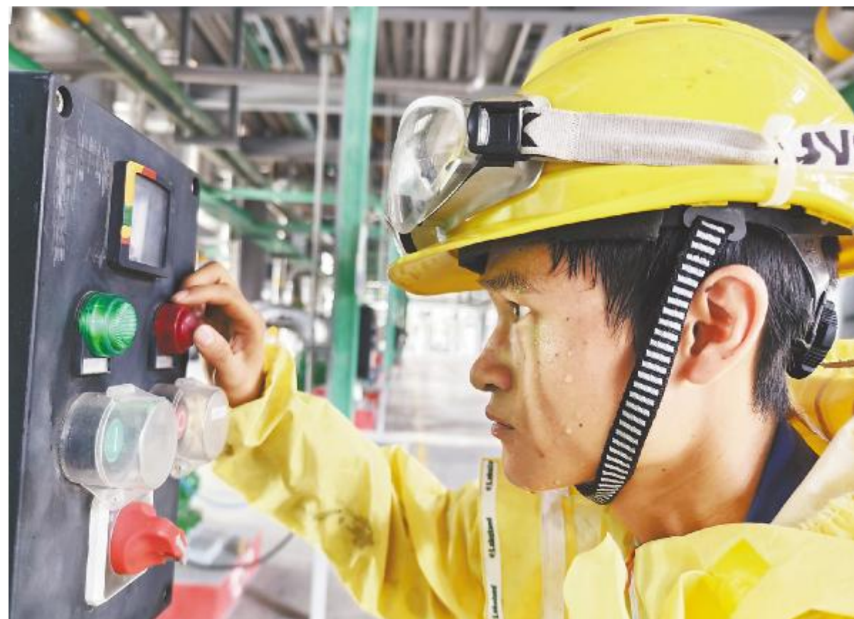
拥抱“夏”,奋斗在“升温”