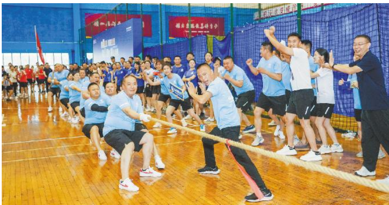
永祥股份代表队力压群雄,获拔河项目冠军

经过激烈角逐,永祥股份代表队勇夺男子200米、400米、1000米、4×100米接力赛跑,女子400米、乒乓球男单、拔河、篮球冠军;男子100米、400米,女子200米、4×100米接力赛跑,跳绳、女子羽毛球单打亚军;女子100米、200米,乒乓球女单季军。这场属于通威人的体育盛会不仅全体通威人青春与活力的见证,也是通过拼搏精神促进大家以更加饱满的热情、更加坚定的步伐,齐心推动通威高质量发展。