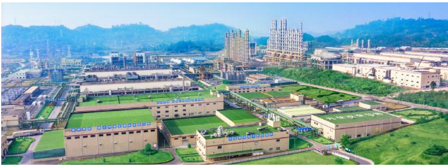
永祥股份绿色工厂