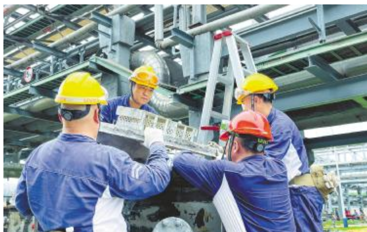
不惧酷暑,齐心协力保生产