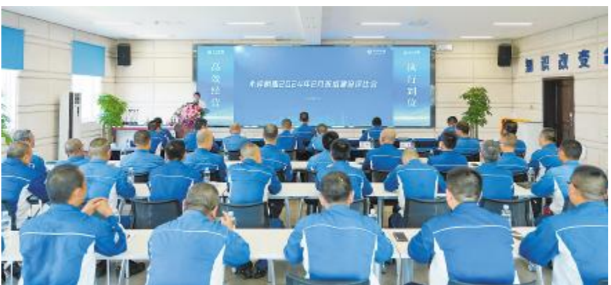
永祥树脂8月班组建设评比会活动现场

从8月8日22时起至8月10日5时47分送电结束,历时32小时,220kV变电站更通线、胜通线送电工作圆满完成,再次彰显了通威硅能源(内蒙古)“一次做到位,事事零缺陷”的追求。“一次做到位,事事零缺陷”,不仅仅是一句口号,更是对工作的极致追求,是开得起、跑得快、稳得住的具体体现。