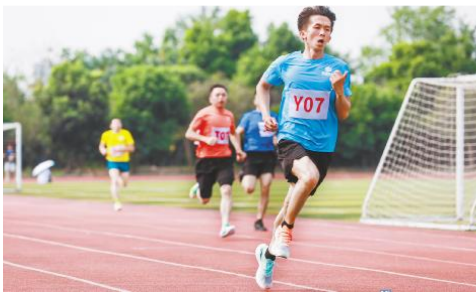
田径赛场上的“速度与激情”