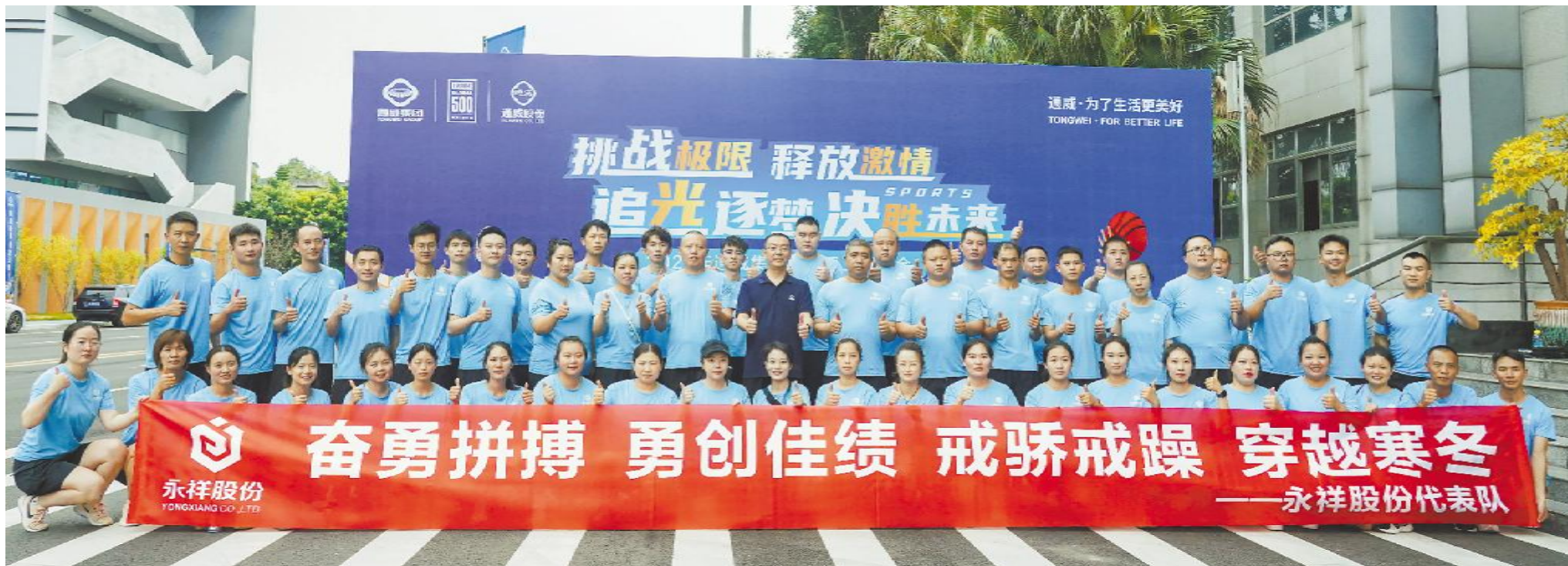
永祥股份代表队合影留念