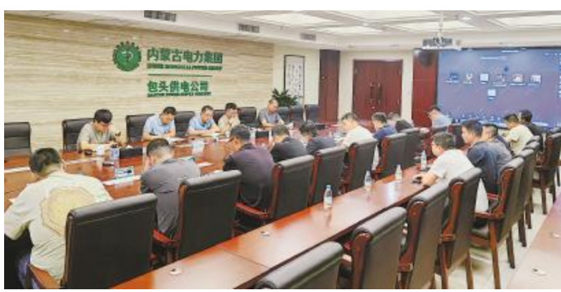
通威硅能源(内蒙古)220kV变电站送电前方案交流现场