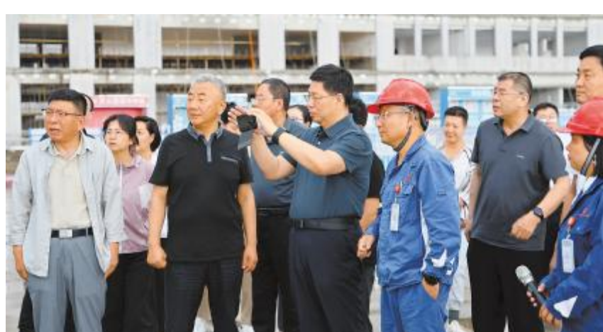
内蒙古自治区政协副主席安润生莅临通威绿材(内蒙古)调研

安润生副主席对项目团队“用心工作,用智慧工作,用只争朝夕的精神工作”表示了高度赞扬,并强调,通威绿材(内蒙古)项目不仅符合当前绿色发展的时代要求,更是包头市产业转型升级的典范,对促进地区经济结构调整、提升产业竞争力具有重要意义。各级政府和相关部门要进一步加大对重点项目的支持力度,优化营商环境,确保项目