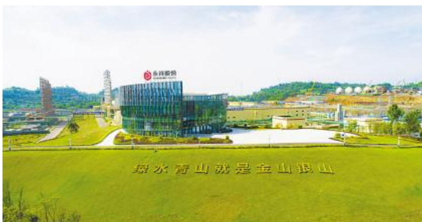
永祥股份花园式工厂

20 多年来,永祥股份通过持续不断的技术研发和工艺创新,从源头上解决安全环保问题,已形成完整的循环经济产业链和物料能源自循环系统,各项指标全球领先。在减轻环境压力的同时,也降低了消耗,节约了生产