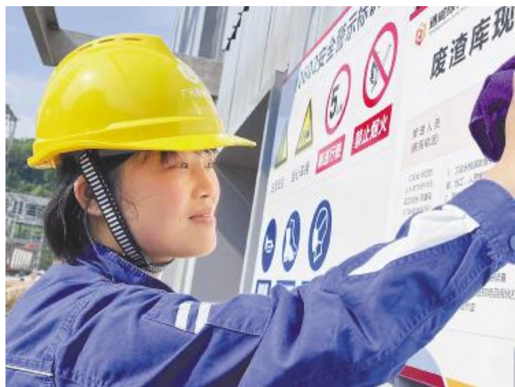
高温考验下,依旧一丝不苟