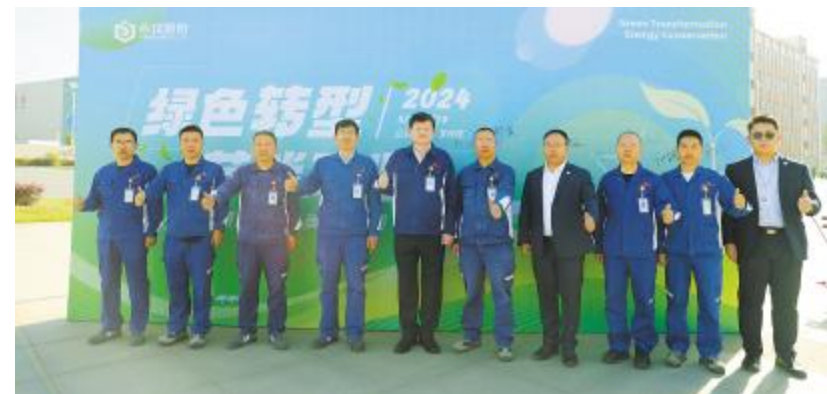
内蒙古通威节能宣传周启动仪式