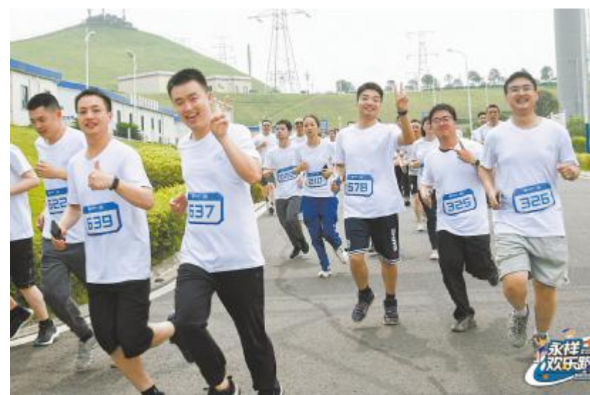
激情开跑,拥抱快乐