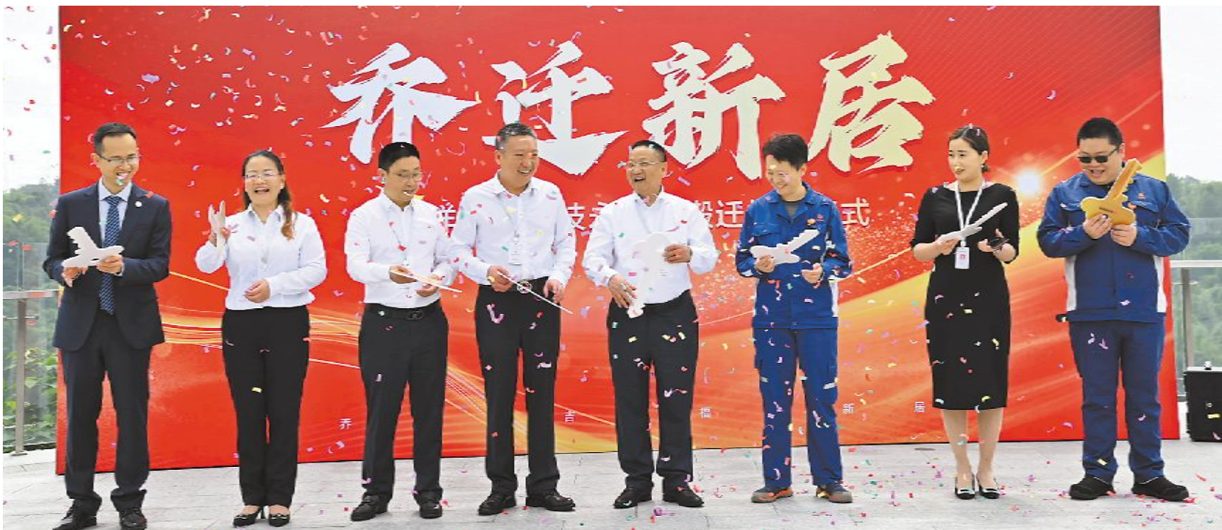
永祥能源科技专家楼搬迁入驻仪式现场

记者 冯书遐 通讯员 许文娟 杨树芬 韩禄 夏依 吴冬梅 喻镭 李元心 杨洪平 陈子璇 陆道婧 王艳平