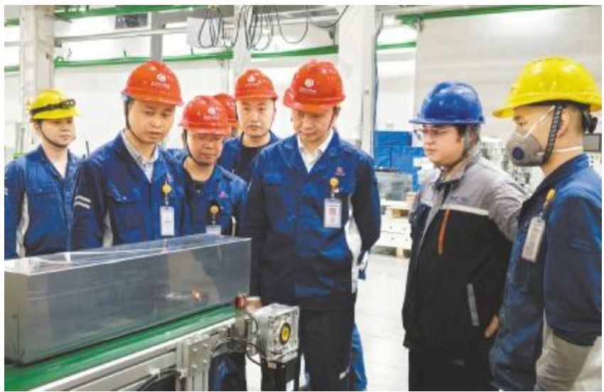
永祥光伏科技机加原料厂综合检查现场