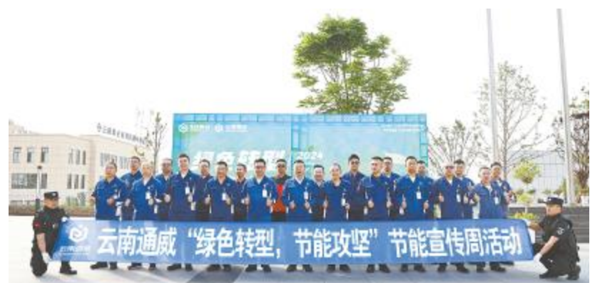
云南通威节能宣传周启动仪式