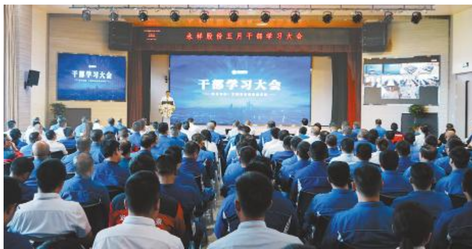
永祥股份5月干部学习大会现场

李总强调,面对行业周期,全公司上下要坚定信心,做好管好自己的事情,才能有效应对所有的竞争和挑战,要99%脚踏实地,1%仰望星空,全体干部员工一起齐心协力穿越行业周期,共同推动光伏产业健康发展。