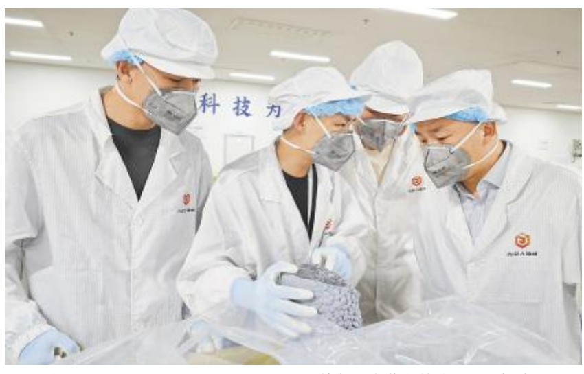
永祥股份品管部赴内蒙古基地质量监督检查工作

线检查指导工作,并对机加自动化及其配套设备工序的运行情况进行了检查。对于新进设备,袁总详细了解了其调试运行效率、质量和性能参数。对于在自动化调试、安装、运行等方面存在的问题,袁总当场指明了改善思路,要求新设备运行初期,要严把质量关,特别是要辨识好新设备、自动化安全风险,稳步落实好安全防护措施,时刻牢记安全第一的理念。袁总强调,当前新设备处于安装调试阶段,要对其工艺设备原理继续研究,做好布局与前瞻工作,确保每个细节都做到位,保障生产效率的持续提升。