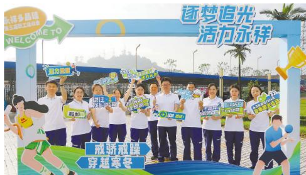
逐梦追光,活力满满