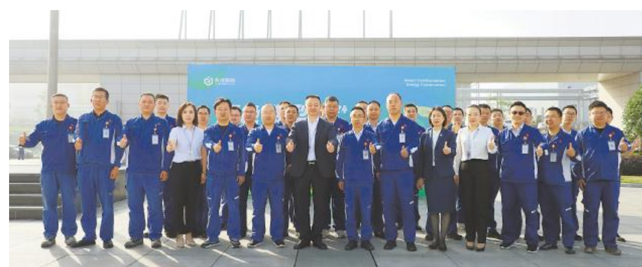
永祥光伏科技节能宣传周启动仪式

我们每一位永祥人都应该全员参与,从公司角度出发,优化工艺、提高设备效能,实现电耗、标煤耗不断降低,身边小事出发,节约每一度电、每一滴水,低碳生活,绿色发展。