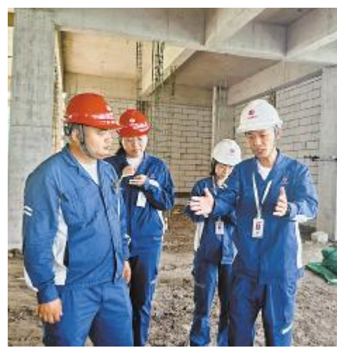
永祥股份品管部在广元基地质量监督检查工作交流现场