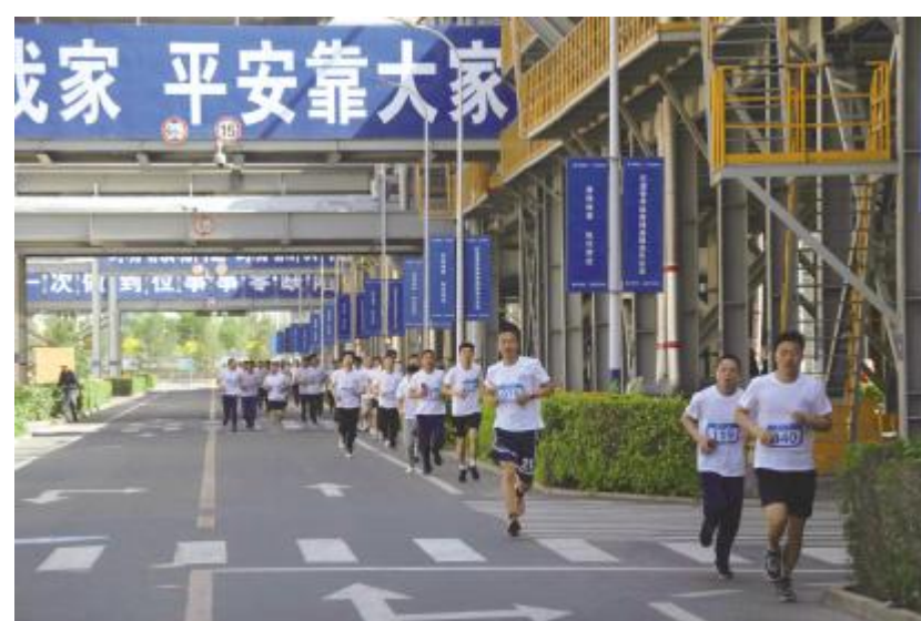
内蒙古通威员工尽情挥洒汗水