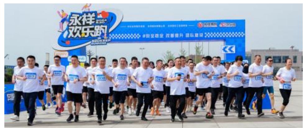
哨声一响,全员奋力起跑