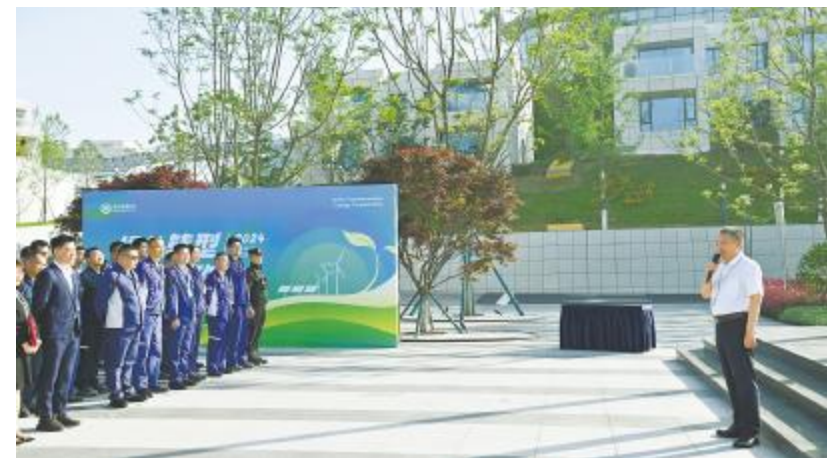
永祥能源科技节能宣传周启动仪式