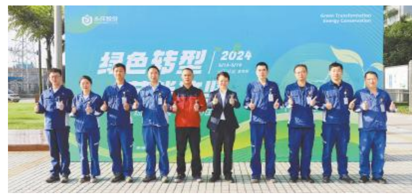
永祥多晶硅节能宣传周启动仪式