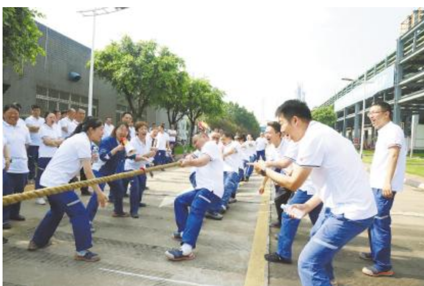
永祥多晶硅职工运动会现场