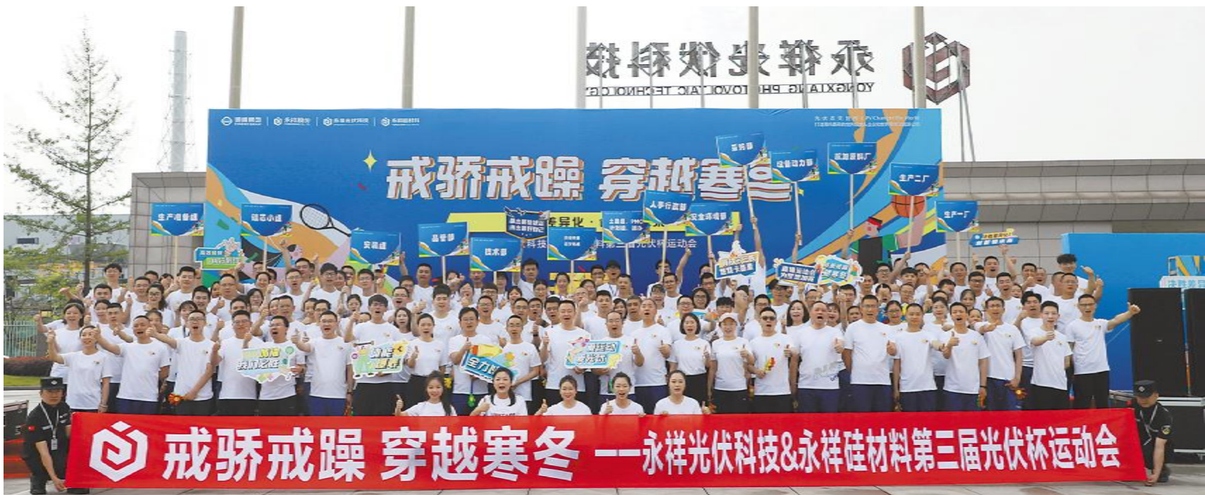
永祥光伏科技 & 永祥硅材料职工运动会合影留念