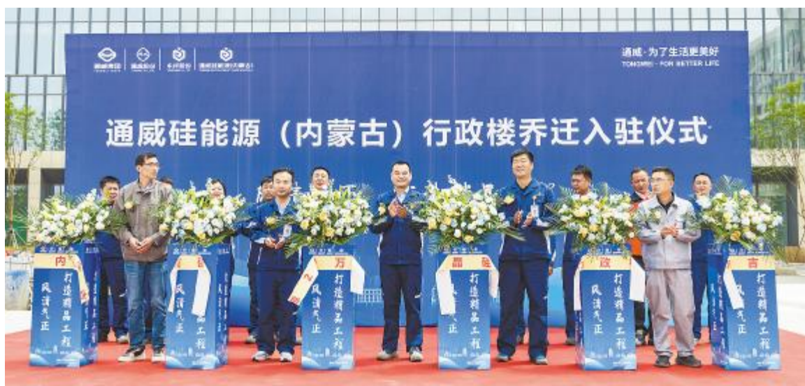
通威硅能源(内蒙古)行政楼乔迁入驻仪式现场