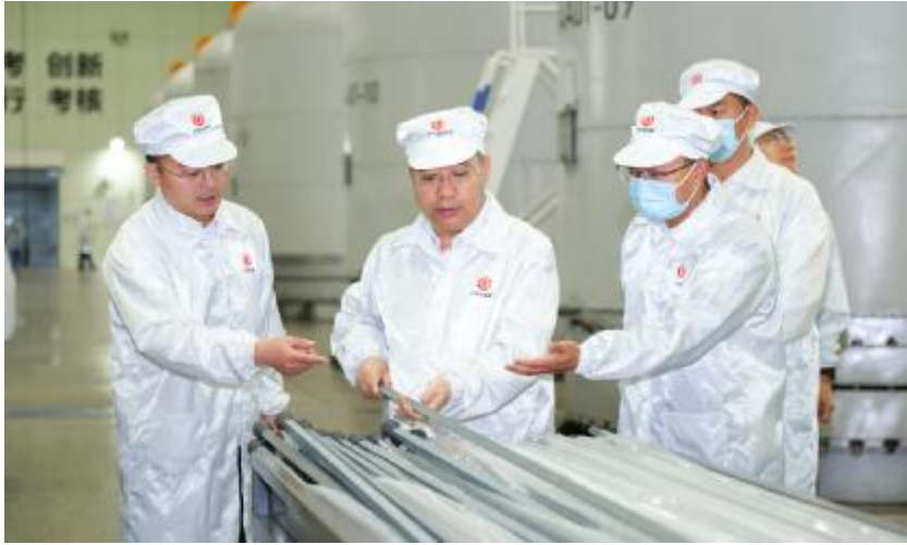
四川省常委、副省长普布顿珠了解永祥晶硅还原工艺

丁总表示,永祥的高速发展离不开各级党委、政府的关心和支持。一直以来,永祥高度重视技术研发,不断夯实技术基础,创新平台建设和技术团队培养,形成了具有自主知识产权的500多项研究成果。同时,永祥始终坚持绿色高质量发展,强力推动中国绿色硅谷“产业链、创新链、人才链”三链互动,不断完善产业链布局,现已形成