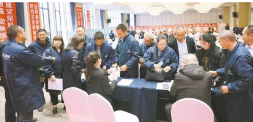
四川通威叉尾越冬0损失大赛签约现场

激动人心的颁奖盛典为本次大会再掀高潮,历时85天的PK周期,按照定期实证打样记录,经过激烈的角逐,比赛共评选出阶段包产组:叉尾养殖高手3名,叉尾养殖能手7名,叉尾养殖好手10名。清塘包产组:叉尾养殖高手1名。其中,2位获奖者分别为大家分享自己的叉尾养殖经验并传授养殖秘诀。