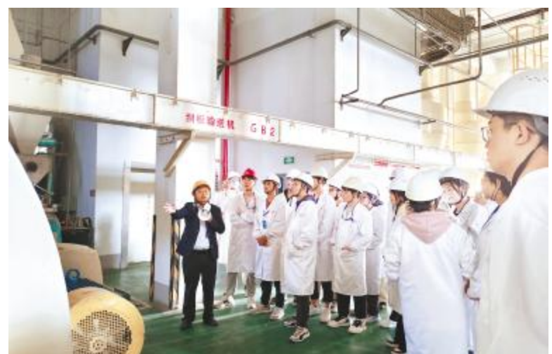
信阳农林学院学生走进生产车间参观学习