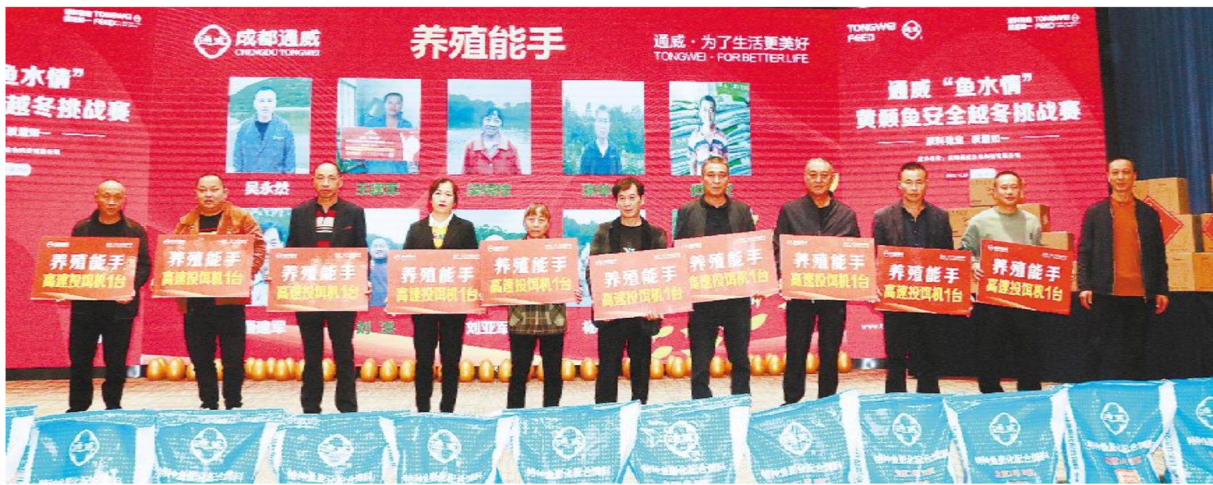
成都通威黄颡鱼安全越冬挑战赛颁奖现场

在行业“开倒车”的年代,通威提出专用对比,帮助养殖户提升养殖技术,保障养殖效益。2023年,是通威“好产品年”,通威邀请用户、媒体监督官走进通威、深入通威、了解通威。品质与诚信是连接通威与客户的纽带,服务亦是桥梁。通过技术交流的养殖比拼,使客户对我们的产品有了更深入的了解,更加坚定了对通威好产品的信心,全体通威人将持续做好用户的跟踪服务工作,让我们共同期待来年有更多的高手与能手登上领奖舞台!