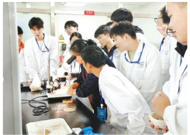
信阳农林学院学生了解农牧前沿技术