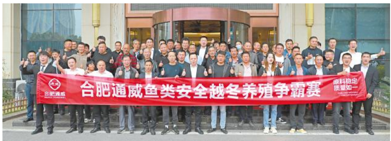
合肥通威春季保鱼颁奖盛典暨鱼类越冬养殖高手争霸赛

本次会议是重庆公司自5月以来持续开展的第12场主场营销活动。早在7月份,陈涛总就提出“重庆通威全年战秋冬”的市场工作指示,要求水产部全员任何时候必须紧盯目标客户,全力开发。