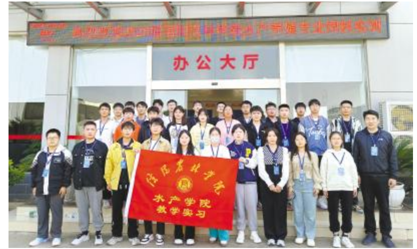
信阳农林学院学生走进通威实训