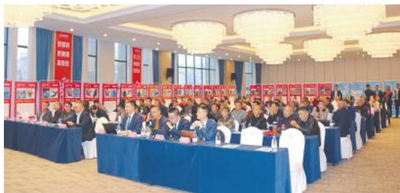
成都通威黄颡鱼安全越冬挑战赛现场