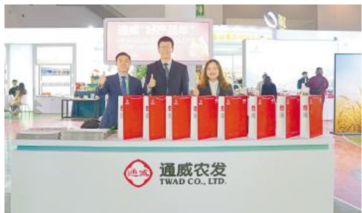
通威农发精彩亮相 2023 第九届四川农业博览会