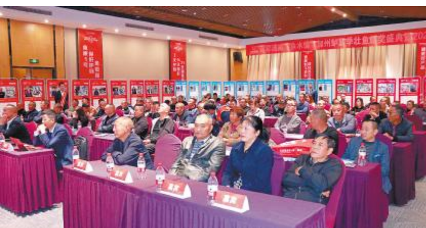
成都通威“鱼水情”安全越冬挑战赛圆满举办

会上对“加州鲈夏季壮鱼高手挑战赛”进行颁奖表彰,历时将近100天的养殖,通过定期的服务打样记录,根据生长速度与饵料系数两个指标进行综合排名,经过激烈的比拼,共评选出养殖高手3个、养殖能手6个、养殖养殖好手11个。