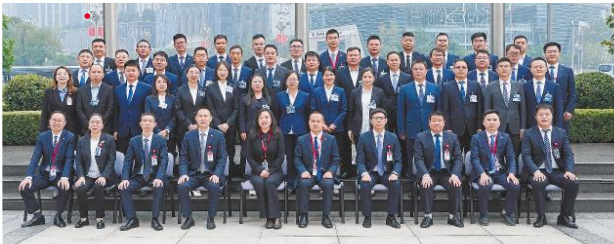
第九届新锐计划圆满收官

报内容进行点评指导。最后,结合学员日常学习参与度与现场达标情况,对顺利结业的学员颁发了结业证书,同时对表现优异的学员进行了表彰。