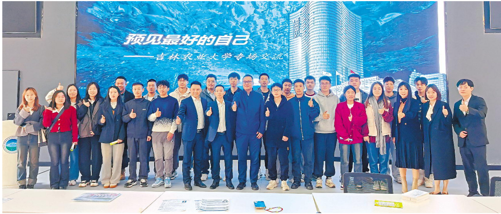
吉林农业大学校园招聘现场