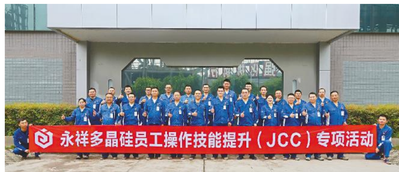
永祥多晶硅启动员工操作技能提升专项活动

全是根、安全是本、安全是所有工作的前提”发展理念。要继续深入推进HZAOP、JSA、JCC等工具,全面落实“安全五法宝”。要通过安全生产标准化推动公司安全管理工作,按标准化12个要素的要求,进行再梳理、再规范、再提升,全员积极主动参与安全管理,全力推动公司的安全管理水平再上新台阶。