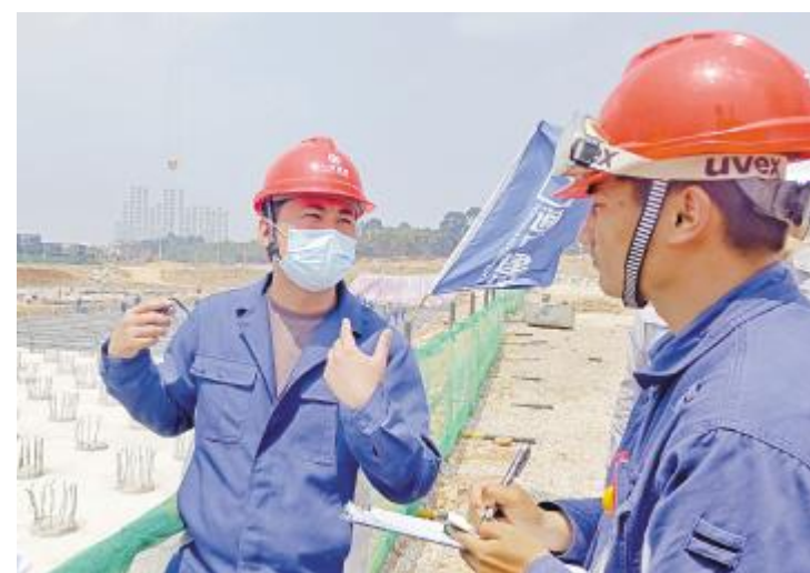
不惧烈日,建设现场有你有我