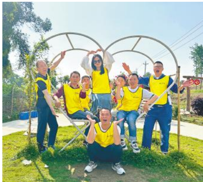
户外拓展凝聚团队力量