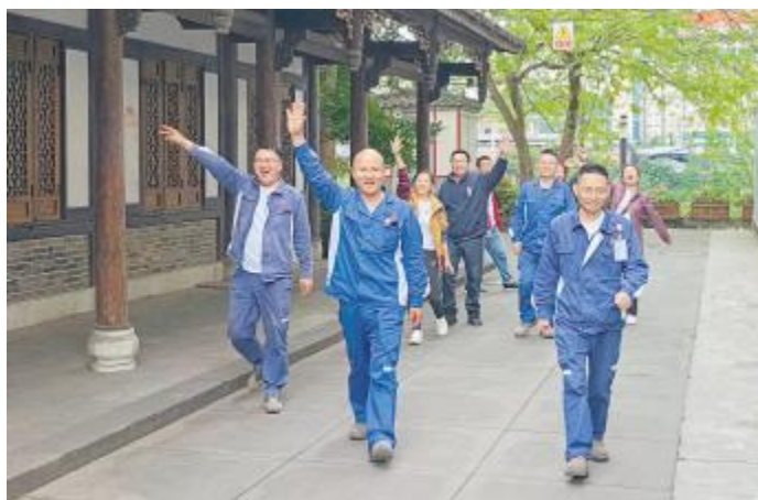
徒步活动有益身心