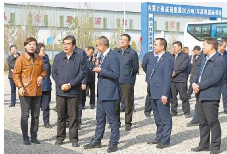
内蒙古自治区党委常委、包头市委书记丁绣峰听取项目介绍

“项目发展潜力巨大,活力无限。”观摩团领导在建设现场纷纷表示,通威作为首家落户包头的光伏行业上游硅料龙头企业,感受到了通威对产业链提升的带动能力,并看好内蒙古通威硅能源的发展前景,对项目信心十足。丁绣峰书记鼓励公司继续抓好经营管理、加强技术创新,进一步推动光伏产业链发展,为巩固推动经济高质量发展贡献力量,并表示,政府职能部门将加强与企业的沟通,主动做好各项服务保障,帮助企业协调解决项目建设中存在的困难与问题,为企业发展创造良好环境。