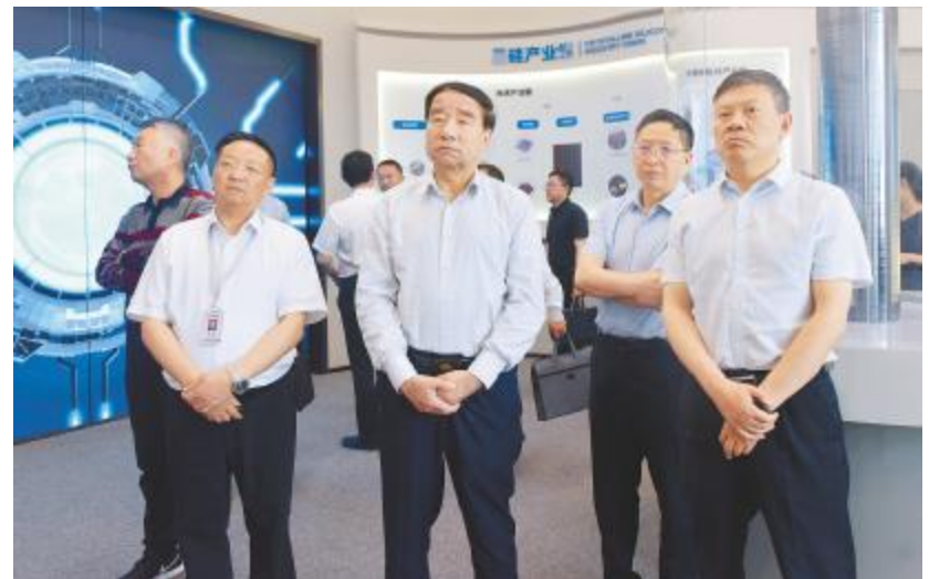
新疆维吾尔自治区政协副主席艾则孜·木沙在永祥股份考察