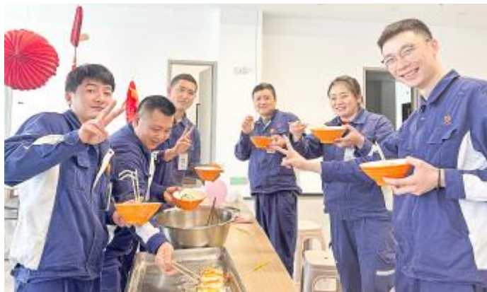
集体生日会其乐融融