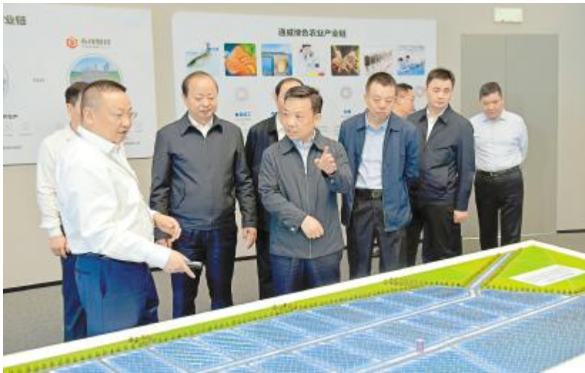
四川省委常委、政法委书记靳磊在永祥股份调研