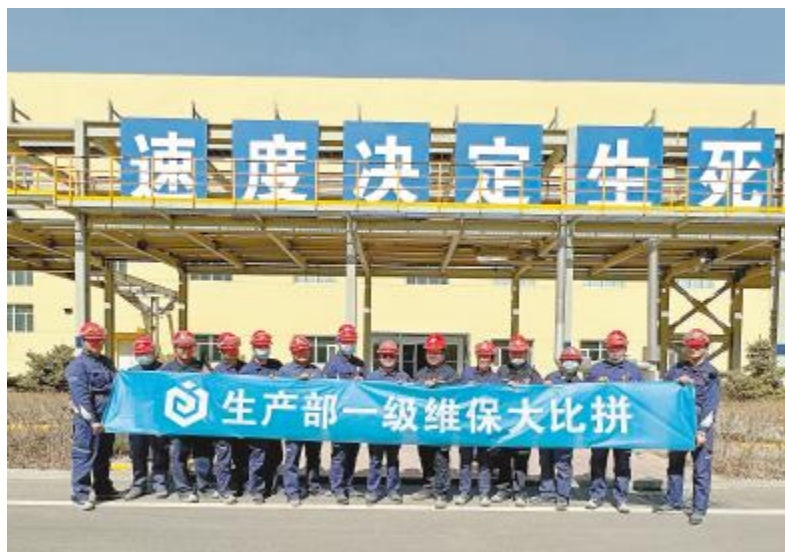
内蒙古通威生产部开展设备一级维保大比拼专项活动