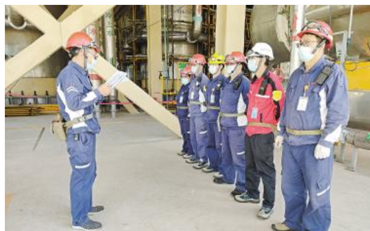
云南通威 回收二班