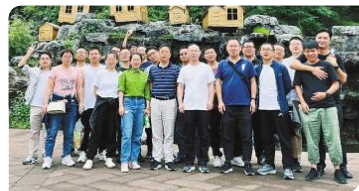
永祥股份信息部开展团队建设活动