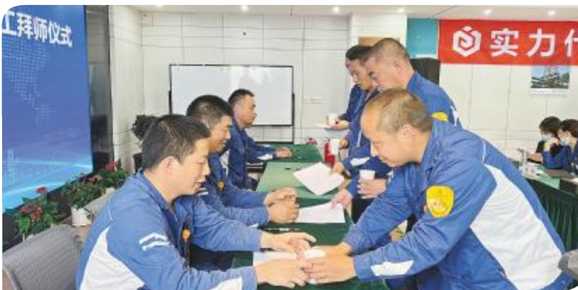
永祥能源科技举行第一期新员工拜师仪式

董主任对能源科技的新员工们表示欢迎,并指出,多晶硅的师傅们有丰富的带教经验,将会把宝贵丰富的知识毫无保留地传授给徒弟们,也希望能源科技的新员工在培训过程中多学多问,严格遵守各项安全制度要求。程部长对多晶硅的领导和师傅们的支持表示感谢,并对师傅带教学习提出要求,强调要做到遵守制度、尊师重道、勤奋好学,强化自身技能,希望大家能早日独立上岗,为能源科技顺利开车作出贡献。