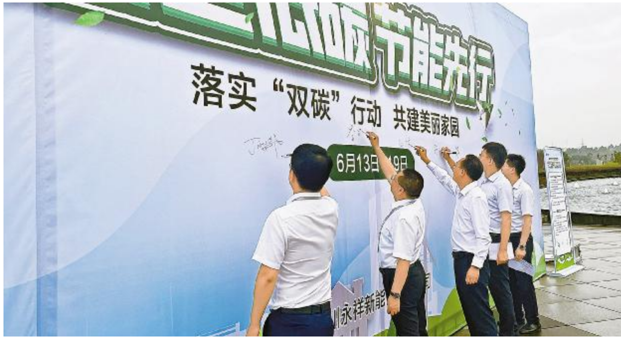
永祥股份启动“全国节能宣传周”活动