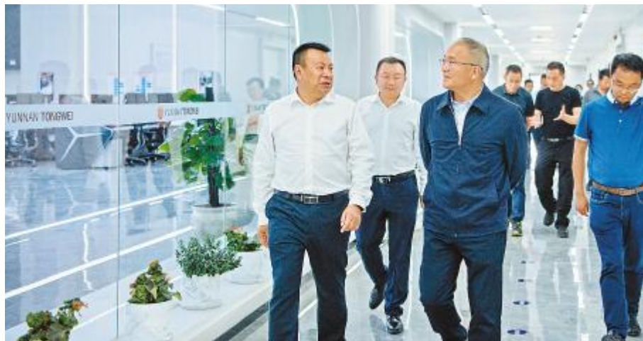
云南省委副书记石玉钢在云南通威调研指导

资质荣誉、技术研发投入等情况,并表示,永祥股份以通威为坚强后盾,始终坚持安全、环保、绿色、清洁生产,赢得了社会各界的高度关注和赞誉。公司弘扬劳模精神和工匠精神,发挥高级技能人才推动经济高质量发展示范引领和骨干带头作用,促进企业科技创新,加快培养高技能人才、高素质创新人才。