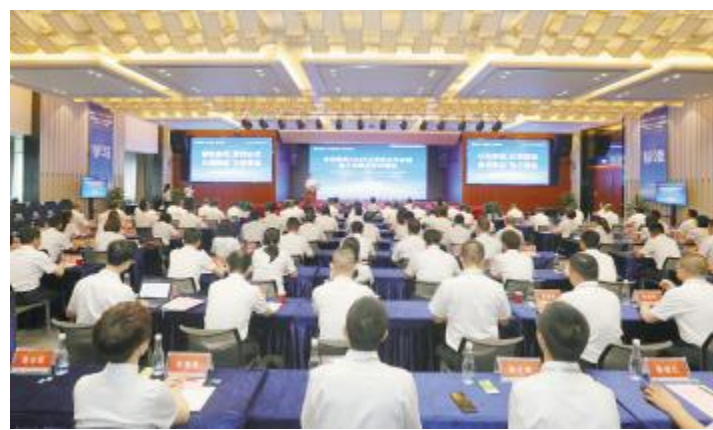
永祥股份2021年上半年总结暨下半年工作计划会现场

会议就下一步管理提升工作思路进行了热烈讨论,提出“高效经营,执行到位”作为以后的经营管理思路,并就鼓励原创、五星评比、干部考核等方面的举措进行了深入研究。