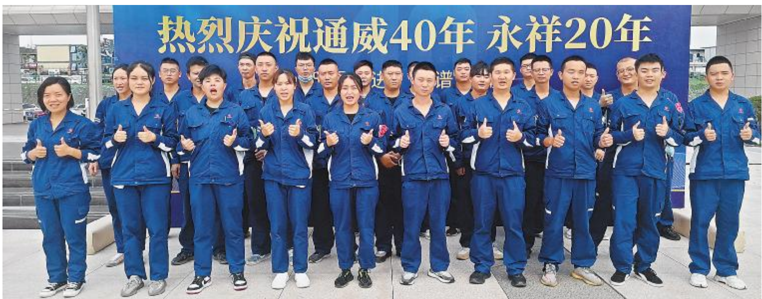
永祥股份员工纷纷在文化墙打卡留念,向通威和永祥表达美好祝福

通威,从眉山一隅走来,跨越山海,拔山举鼎。 筚路蓝缕,以启山林,鸿鹄之志,不坠青云。 四十载风雨兼程,生生不息,天道酬勤,屹立世界之林。 通威,永祥更是恰如其分相遇, 赋予五通城外那片古老的山林以生命; 精馏塔、单晶炉、现代化办公楼拔地而起; 永祥股份巍峨矗立,城内城外随处可见一袭蓝衣。 通威、永祥合二为一,如虎添翼。 农牧产业首屈一指,渔光一体创举之举,晶硅领域所向披靡。 大音希声,大象无形,不惑之年飞云踏海,开天劈地,引领时代风云。