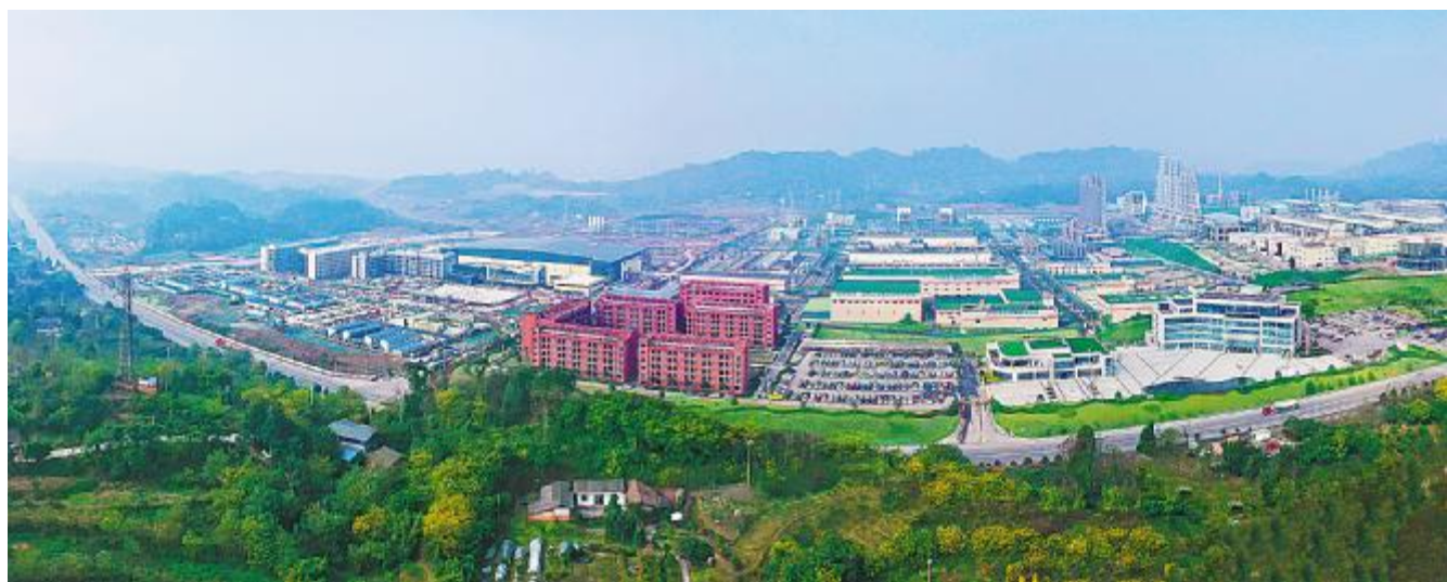
为“中国绿色硅谷”建设贡献永祥力量

看永祥股份的十个兄弟,正在放飞腾飞梦想。 祝福所有的永祥家人朋友们,快乐每一天。 人人笑开颜,恭贺万万千。 为永祥多晶硅点赞,为永祥新材料和永祥树脂喝彩。 为永祥新能源和云南通威加油,为清洁能源奋斗。 祝福我们清洁能源的明天更加辉煌灿烂!