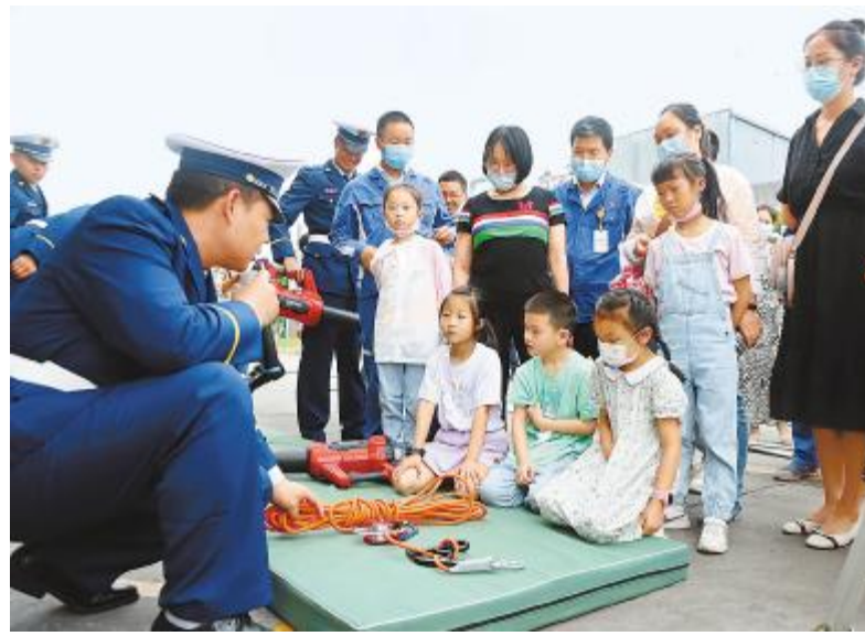
员工家属参观消防安全装备

在能源转型和“双碳”目标的大背景下,以光伏为代表的可再生能源,已成为助力“双碳”目标实现的主力军。面对新一轮的机遇,永祥股份将继续践行节能降碳行动,持续打造高效节能、绿色低碳、安全环保的智慧化工厂,在能源革命和碳中和道路上贡献更多积极力量。