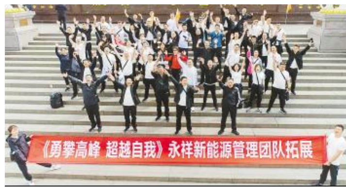
永祥新能源2022年度管理团队拓展活动