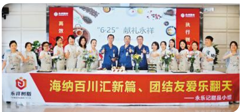
永祥树脂永乐记甜品兴趣小组举行“6·25”献礼活动

永祥股份的发展取得了优异的成绩,企业文化建设功不可没。作为公司的软实力,永祥股份各分子公司在通威文化的引领下,通过开展丰富多彩的文化活动,不断凝聚全体员工的共识,形成强大合力,塑造了活力十足的团队氛围,有力地促进了团队建设,打造了“军队、学校、家庭”的永祥特色人力资源管理体系,为企业发展提供了强有力人才支撑。 记者 刘奕锋 通讯员 邵笛 卢艳玲 敖玲 石敏