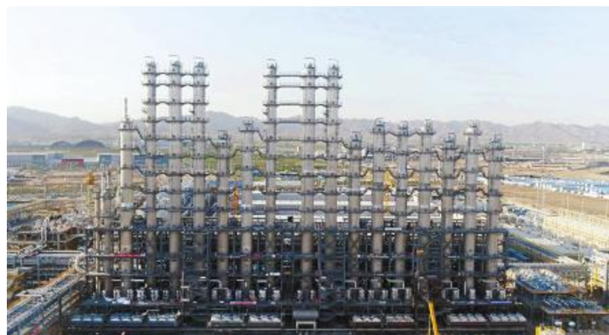
内蒙古通威二期进入冲刺阶段