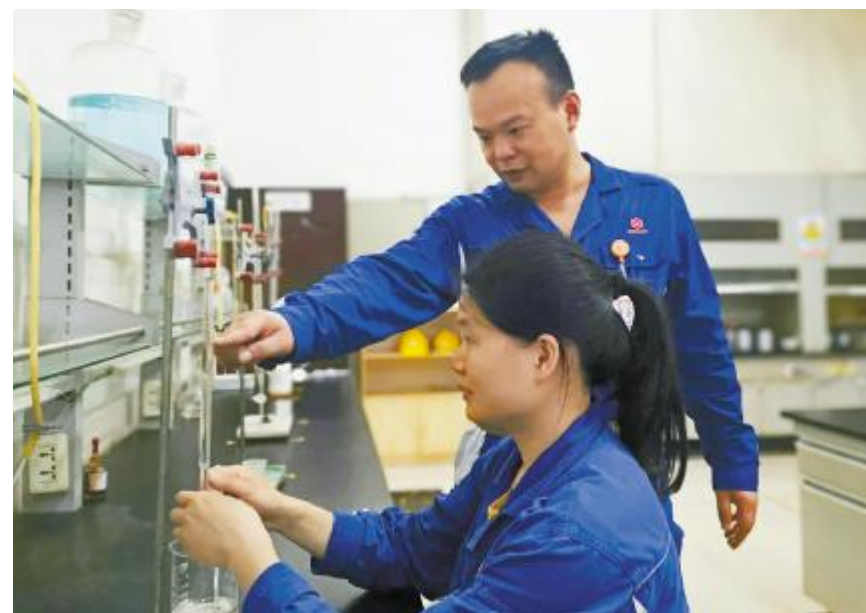
一丝不苟,把控质量

“20年来,永祥凭借过硬的产品质量,不断发展壮大。但是,质量之路道阻且长,我们一刻也不能停歇,要拿出‘我的岗位我负责,我的工作请放心’的责任之心,以技立业,以质立心,不断追求卓越,砥砺前行,奋进不止,为永祥的未来、通威的未来添光增彩!”