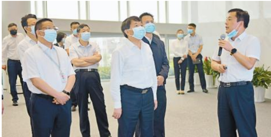
四川省委常委、常务副省长罗文莅临永祥股份调研