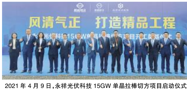
2021年4月9日,永祥光伏科技15GW单晶拉棒切方项目启动仪式