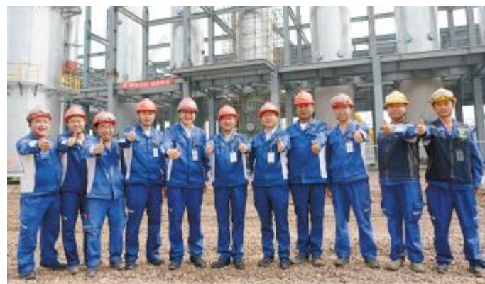
2021年6月28日,永祥新能源精馏塔最后一吊完成

2022年1月18日,云南通威一期5万吨高纯晶硅项目首批高纯晶硅正品成功出炉,产品质量各项指标均优于太阳能级特级品标准。至此,永祥股份已拥有四川乐山、内蒙古包头、云南保山三大基地,打造出全球单体规模最大、综合能耗低、技术集成新、品质优的智能制造生产线,高纯晶硅产能总规模超过18万吨,产能和市占率全球第一。