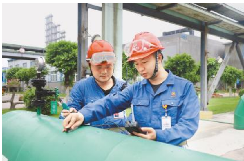
认真指导,共同提升

“只有我们所有人都做好了日常的每一件小事,公司才能完成伟大的理想。我们化工人要将‘匠心’积极运用到‘匠行’中,用最标准的标准做最简单的工作,用最细心的态度做最细节的小事。这样,通威这艘巨轮才能平稳行驶。祝愿通威和永祥,在新的奋斗征程中,乘风破浪,到达梦想的彼岸。”