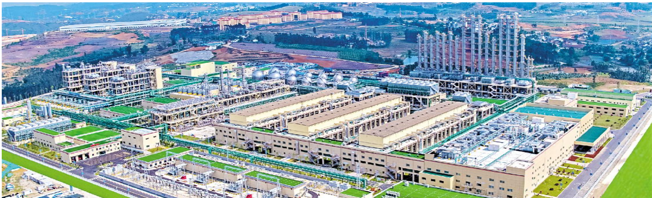
云南通威高效生产,助推能源转型