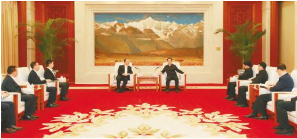
通威集团董事局刘汉元主席与云南省委副书记、省长王予波举行工作会谈

目前,通威旗下的永祥股份三大高纯晶硅生产基地均保持高效生产,高纯晶硅产品质量和产能全球领先,为中国光伏产业发展作出了积极贡献,赢得了各方领导肯定。作为当地的重点企业,通威也为当地的经济注入了新动能、新活力。未来,通威将继续聚焦聚力,进一步提升核心竞争力,实现持续稳健发展,在能源转型升级和实现“双碳”目标中交出优异答卷。