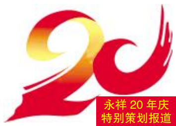
永祥20周年庆特别策划报道

光阴似箭,时光如梭。20年前,永祥从乐山市五通桥区起步,驰而不息、久久为功,现在已打造了四川乐山、内蒙古包头、云南保山三大高纯晶硅生产基地,产能全球领先,从小树苗成长为参天大树。20年来,永祥不断吸引着有理想、有梦想的人,加入这个积极向上的团队。在通威这个大平台、永祥这个大家庭,永祥全体干部员工只争朝夕、奋勇向前,与时代同行、与公司同步,实现了成长和蝶变,在奉献中实现了人生价值。在通威40年华诞、永祥20年庆到来之际,他们衷心地向通威、向永祥道出了最诚挚的祝福。