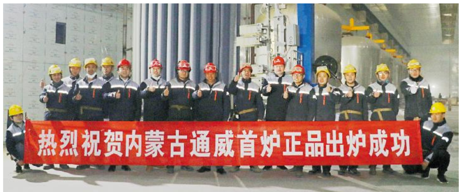
2018年11月25日,内蒙古通威一期项目首炉正品出炉成功