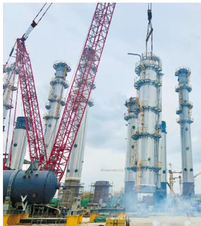
2021年6月1日,云南通威首座精馏塔封顶成功