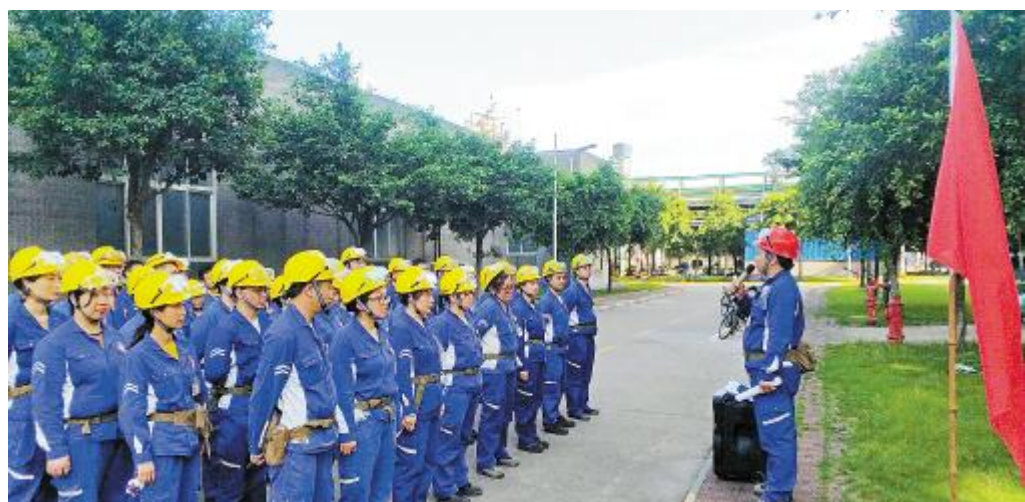
永祥多晶硅调度室组织开展大网失电应急预案演练

启动仪式只是“安全生产月”活动的序曲,接下来,内蒙古通威将全力营造出更为浓厚的安全氛围,大力弘扬安全文化,夯实安全基础,确保安全生产持续稳定。