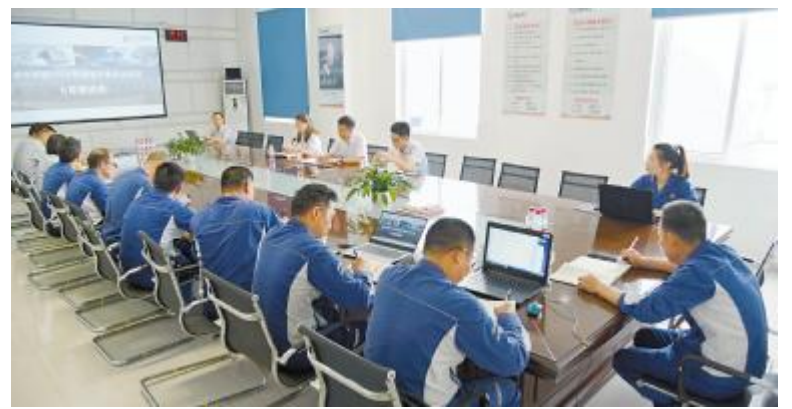
永祥树脂液氯平衡攻关项目推进会成功召开

永祥新材料自2016年以来,一直致力于产品质量提升:控制原料进厂质量关,不合格的按时退货;加强过程质量控制,合格率提高了45%;完善质量考核机制,加大了奖惩力度,做到了奖罚分明;对标先进企业,“走出去、请进来”,扬长避短,以高标准高要求为方向,以市场需求、客户要求为目标,取得显著成效。未来,永祥新材料将继续坚持“质量是企业生命线”的准则,以高标准严控生产的高质量,把好出厂水泥质量关,以行业顶层为标杆,不断追赶,提升企业竞争力与创造力。