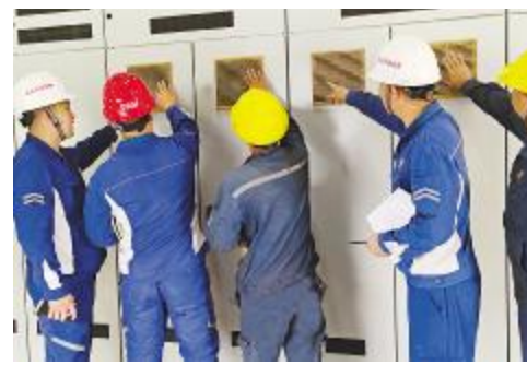
永祥硅材料开展电气设备安全隐患排查活动