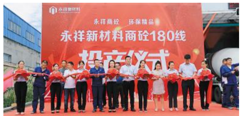
永祥新材料商砼180生产线竣工投产仪式成功举行