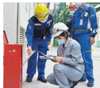
专家组深入永祥生产一线检查