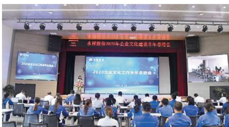
永祥股份 2020 年企业文化建设半年总结会现场

在疫情期间传播文化、做好宣传,为公司打赢疫情防控战做好了各项服务工作,做出了永祥特色。各公司企业文化活动百花齐放,“女神节慰问”“植树节”“欢乐跑”“庆六一”“员工家属接待日”“网红打卡”“大讲堂,大家讲”等活动,进一步促使文化落地,深入每一位员工内心。会上,对在2020年企业文化建设工作中表现优秀的宣传员进行了表彰。