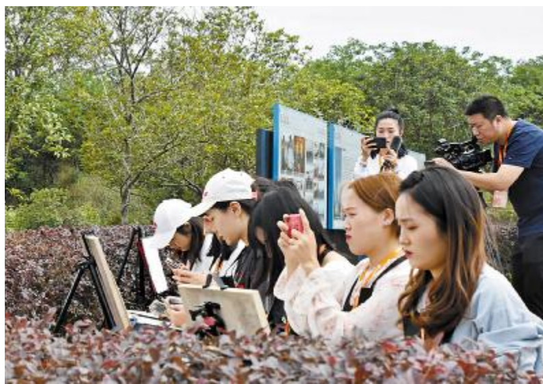
永祥股份“花园式”工厂吸引美术学校师生走进公司厂区写生

形式聚焦战高温斗酷暑、工程建设以及端午、中秋、国庆、春节等传统节日,继续发挥文化引领作用。会议对下半年工作作出相应要求,要求夯实工作基础,提升宣传能力,在传播方式、新闻由头、新闻点挖掘方面进行创新,要想在前面,干在实处,走在前列。遵照通威集团董事长刘汉元主席的指示,“眼中有故事,心中有格局,脚下有泥,心中有光!”