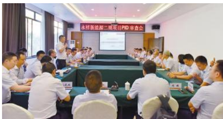
永祥乐山高纯晶硅二期项目PID审查会现场

袁总强调,今年上半年生产经营稳定,成绩来之不易,市场挑战仍在,全员要静心思考如何进一步提升,要积极应对挑战,分析自身,补齐短板;要提升员工“照单执行”意识,杜绝低级错误。袁总号召,全员要齐心协力,推动指标持续向好、成本优化,不断提升竞争力。以“安全活动月”为平台,开展一系列的安全活动,警醒员工执行到位,保证装置安全稳定连续运行,全体员工要奋起脊梁,精诚团结,共同努力。