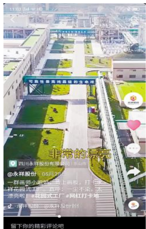
永祥股份原创抖音获员工关注