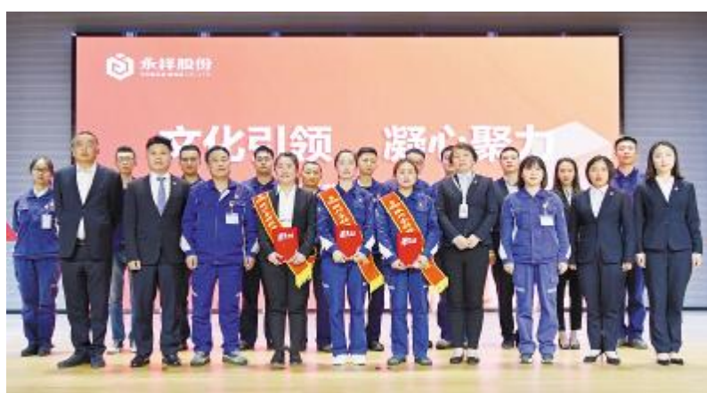
永祥经营哲学案例宣讲系列大赛持续举行,传递正能量

例宣讲系列大赛和巡回宣讲活动,进一步促进文化植入人心。通过各项主题活动,因地制宜地宣传永祥文化,树立良好的企业形象,取得了良好的宣传效果。基本实现平面与新媒体双翼齐飞,尤其是永祥故事系列,挖掘经典,凝注永祥文化,成为鲜活教材。在具体工作中,强化服务输出,工作赋能,提高工作能效,打好了文化建党政工的组合拳。