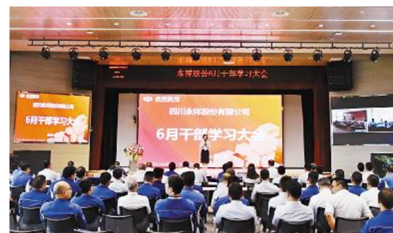
干部学习大会现场

好标准管理,加强风险把控,八大高危管控、JCC检查,用好清单管理,要以空杯的心态去拥抱信息技术,扎扎实实做好安全工作,只有做好了安全工作,产能、成本、利润才有保障。要不断自我总结与批评,举一反三,学会自我照镜子,不断前进,才能活下来,才能活得好。在上下同心努力奋斗下,我们度过了今年最困难的时期,将迎来光伏行业新的机遇。面对市场发展形势,必须做好安全工作,