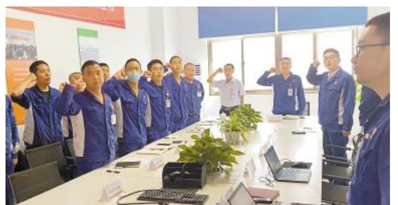
永祥硅材料5月安环工作总结暨6月工作计划会议,全员进行安全宣誓