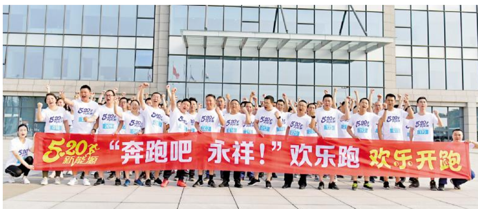
永祥新能源“欢乐跑”活动热闹上演